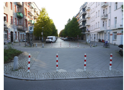
Die Kopenhagener Straße wurde von der Schwedter Straße abgekoppelt, um den Verkehr in der Wohnstraße zu begrenzen