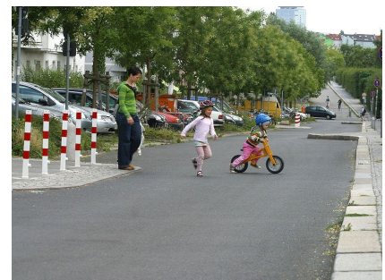
Gehwegvorstreckungen erleichtern allen das Queren der Fahrbahn