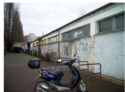
Das Funktionsgebäude vor dem Umbau