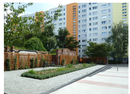
Der erneuerte südliche Zugang zum Platz mit grüner Ruhezone