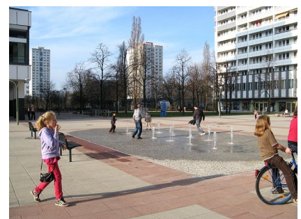
Das neue Wasserspiel auf der zentralen Platzfläche